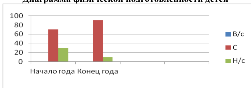
2-я младшая группа Диаграмма физической подготовленности детей