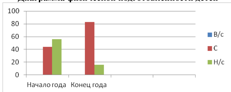
Диаграмма физической подготовленности детей