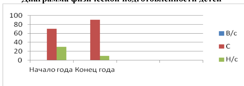
2-я младшая группа Диаграмма физической подготовленности детей